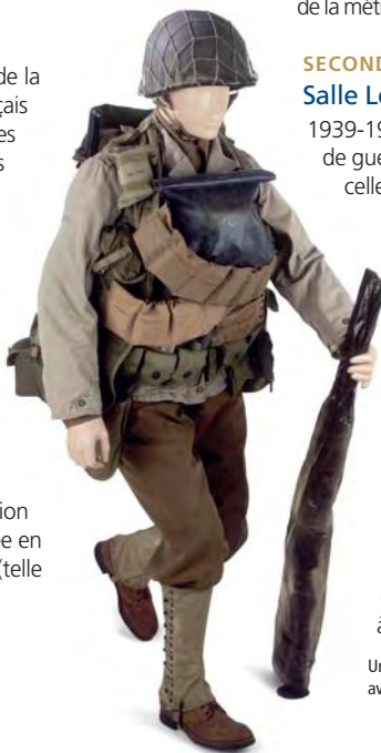
Uniforme de GI en tenue de débarquement avec gilet d'assaut 'première vague'

1944-1945, les « années lumières » sont marquées par les débarquements, les libérations, les capitulations successives, allemande et japonaise. Un espace spécifique est consacré à la découverte et à la libération des camps.