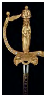
Épée d'honneur offerte par la ville de Paris au maréchal Foch

Le début du parcours débute par un bilan de la défaite de 1871, puis évoque la réorganisation militaire et la construction par la III e République d'une armée de conscription. Sa montée en puissance et la marche vers la revanche jalonnée de crises (telle l'affaire Dreyfus) sont rappelées.