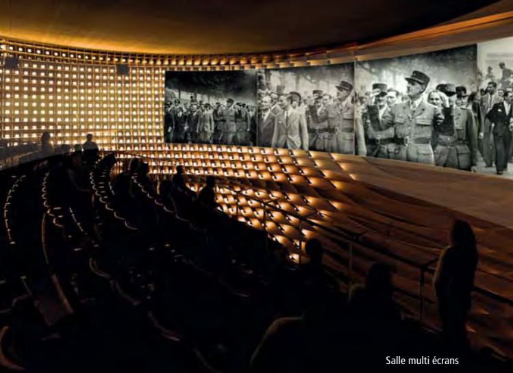
Salle multi écrans