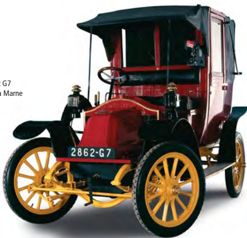
Taxi Renault G7 dit taxi de la Marne

Les étages de l'aile Occident de la cour d'honneur accueillent le département des Deux Guerres mondiales 1871-1945, sur plus de 3500 m 2 répartis sur 3 niveaux. Cette présentation de la « guerre moderne de 30 ans », selon la formule du général de Gaulle, s'organise en sept séquences.